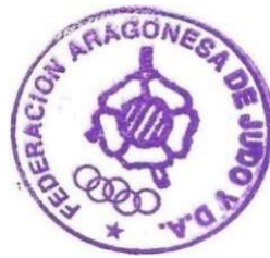
Fdo.- RAÚL CLEMENTE SALVADOR